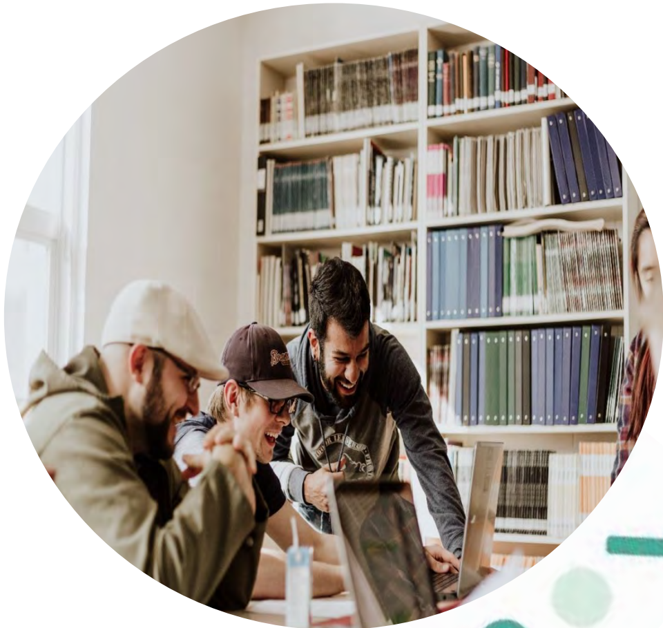
Figuur 2

Hallo, fijn dat jij je in deze moeilijke periode ook wil inzetten voor jongeren en hun mentaal welzijn! In dit draaiboek geven we je een kader en handleiding om in jouw gemeente of buurt een 'gevoelsplek' te maken. Dit is een plek waar kinderen en jongeren met een bepaald gevoel terecht kunnen, vb. frustratie, angst, verdriet, ... Belangrijk is dat deze plek bedacht en vormgegeven wordt met en door jongeren zélf.