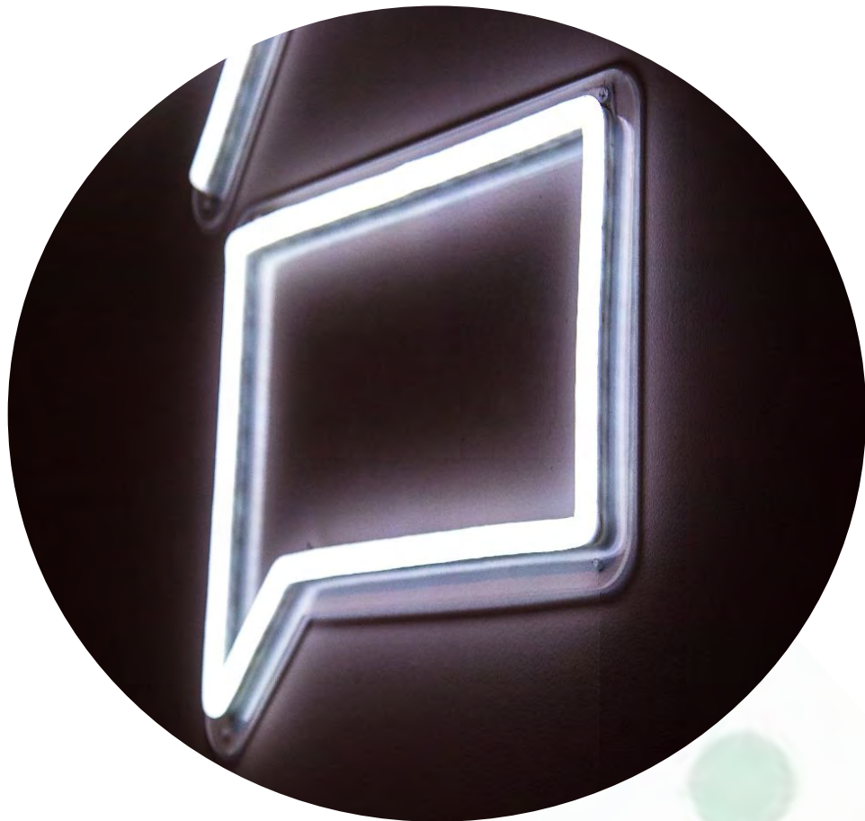
Figuur 3